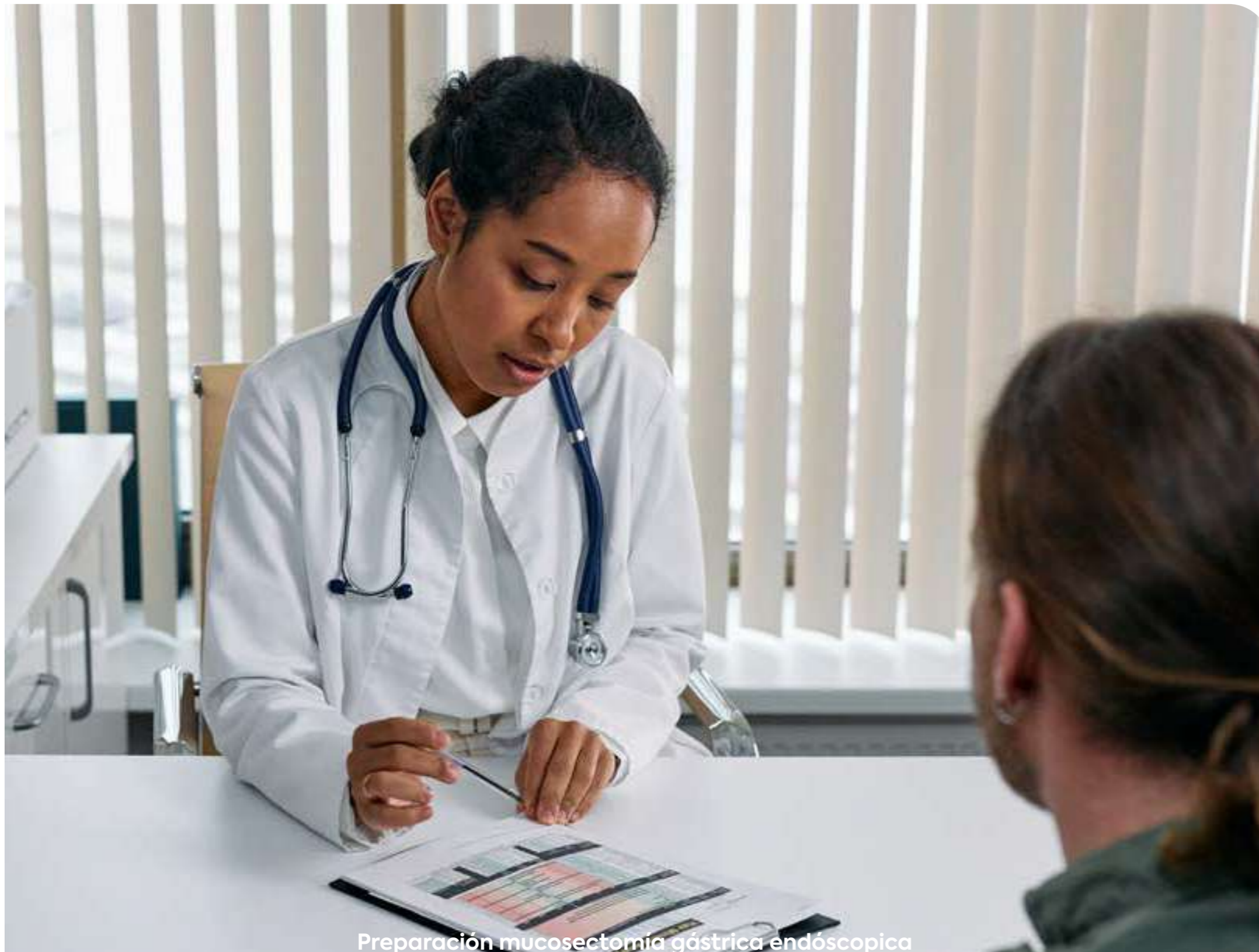
Preparación mucossectomía gástrica endoscópica