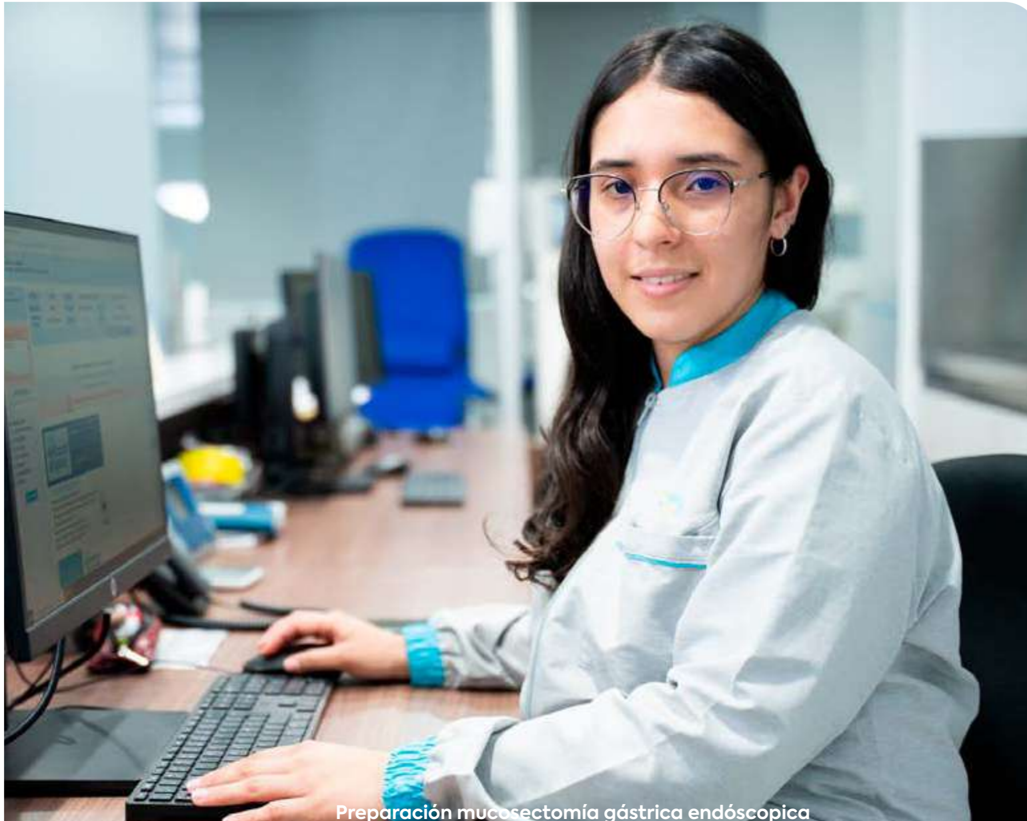
Preparación mucossectomía gástrica endoscópica